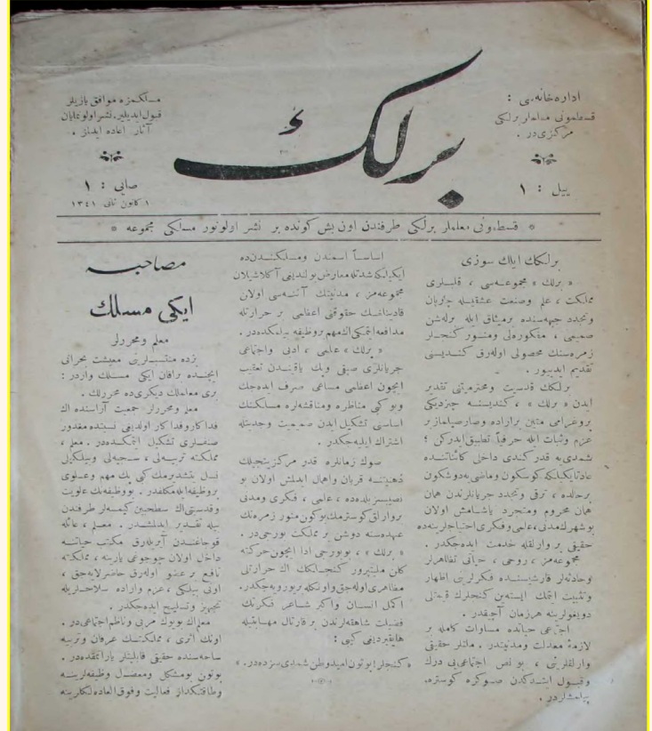
* Kastamonu Mu'allimler Birliği tarafından onbeş günde bir neşr olunur meslekî mecmu'a BİRLİK*